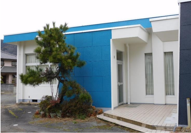
旧水尾町公民館玄関